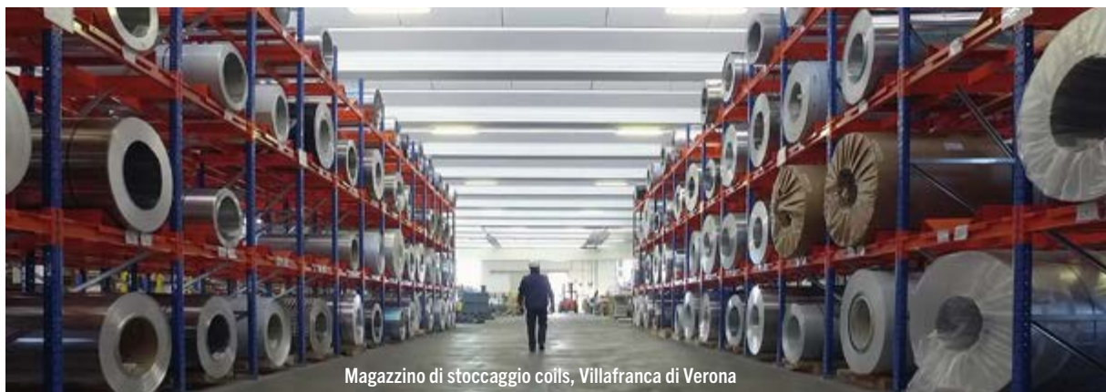
Magazzino di stoccaggio coils, Villafranca di Verona

La fiducia si costruisce nel tempo ed è la risultante di un percorso che l'azienda compie da un lato nel costruire il suo vantaggio competitivo, costituito dalla qualità delle risorse umane che è riuscita ad attrarre e dalla combinazione prodotto/servizio che è riuscita a perfezionare, e dall'altro lato nel dimostrare alla propria clientela di riuscire costantemente a rispettare i propri impegni, con l'obiettivo di essere sempre all'altezza delle aspettative. In altre parole, la fiducia che otteniamo è la conferma che l'azienda riesce a crescere in maniera sana, creando valore condiviso per tutti i suoi stakeholder: ne siamo certamente orgogliosi ed è per questo che insieme al Bilancio di Esercizio 2022, quest'anno pubblicheremo il nostro primo Bilancio di Sostenibilità.